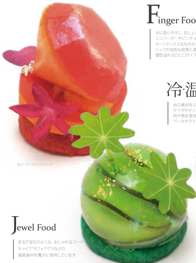
赤ピーマンのムースリング