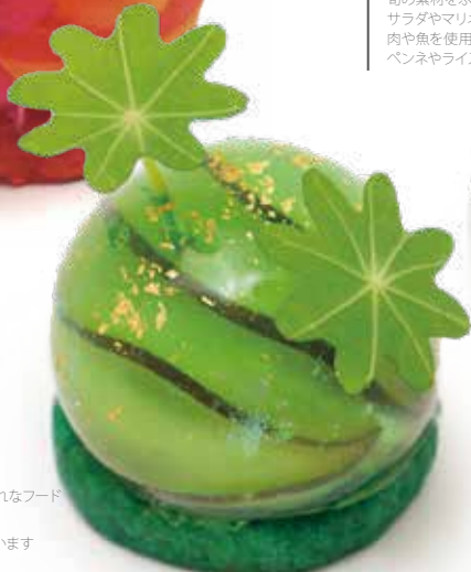
フォアグラのテリーヌ青梅の香り

まるで宝石のような、おしゃれなフード キャビアやフォアグラなどの 高級食材を贅沢に使用しています