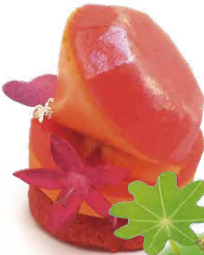
赤ピーマンのムースリング