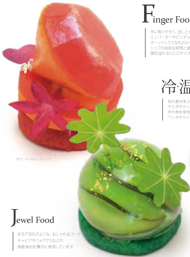
赤ピーマンのムースリング